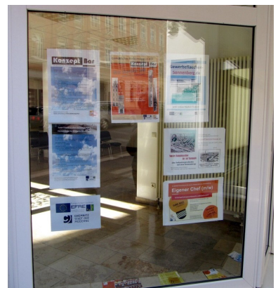
Konzeptbar Fürstenstraße 41