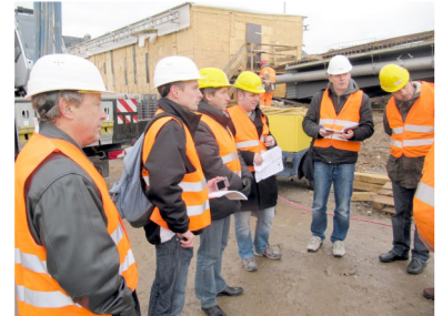
Baustelle Dresdner Platz