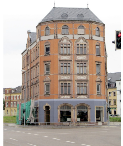
Augustusburger Straße 102