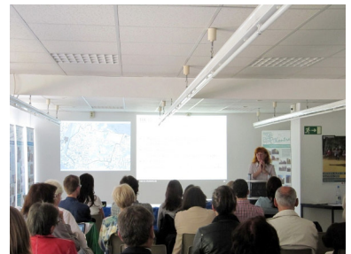
Auswertung der Befragung

23.Juni Die Häuser Körnerstraße 13 - 22.000 €, Körnerstraße 15 - 19.000 € und Körnerstraße 15a - 23.000 € stehen zur Versteigerung in Berlin.