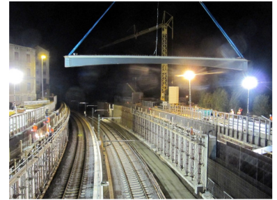
Der erste Brückenträger

15.Oktober Beginn der Montage der 68 Brückenträger am Dresdner Platz