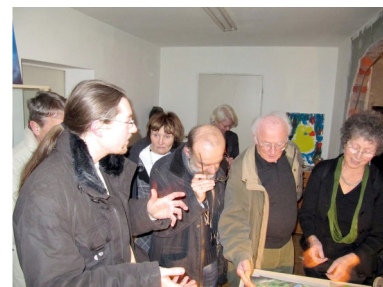
Atelier Sebastian Nikolitsch

24. Januar Stadtteilkonferenz in der Georg-Weerth-Mittelschule mit Wahl des neuen Stadtteilrates