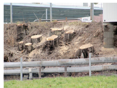
Stadion an der Gellertstraße

23. Januar Die Bäume im Stadion an der Gellertstraße werden gefällt als Vorleistung für den Komplettumbau des Stadions