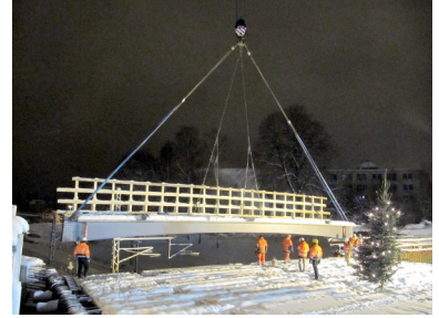
Der letzte Brückenträger