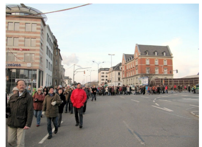
Die Sonnenberger (-innen)

5. März Chemnitzer Friedenstag anlässlich der Zerstörung der Stadt am 5. März 1945 - Sternmarsch von Chemnitzer Kirchen aus zum Neumarkt, u.a. von der Markuskirche aus