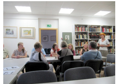
„Atelier 8 bis 80“