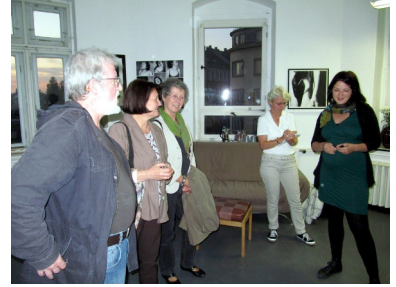
Atelier von Franziska Kurz

13. September Sonnenberg Kunstgespräch bei der Fotografin Franziska Kurz, Augustusburger Straße 102