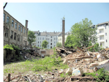
Sebastian-Bach-Straße 4, HG

29. Januar Die Ordensgemeinschaft der Salesianer feiert 20 Jahre Jugendarbeit in Chemnitz, u.a. im Don-Bosco-Haus