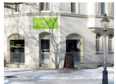
Würzburger Straße 33