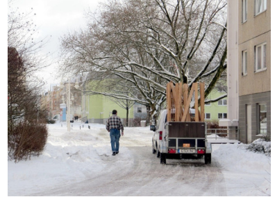
Umzug der AG Sonnenberg-Geschichte

15. Februar Umzug der AG Sonnenberg-Geschichte von der Sonnenstraße 36 in die Martinstraße 19