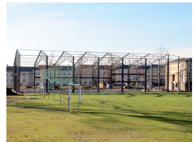
Jahnkampfbahn Fürstenstraße 87

6.Dezember Eröffnung des Vegan-Ladens „PEACE FOOD“ in der Würzburger Straße 33, Sieger im Gründungswettbewerb „Ladenwirtschaft“ für den Sonnenberg innerhalb des Projektes Gewerbe- und Geschäftsstraßenmanagement Sonnenberg.