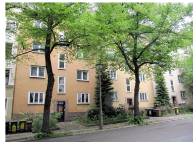
Körnerstraße 13, 15 und 15a